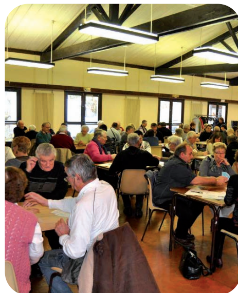
Une salle bien remplie pour une Première

Nous serons heureux de vous offrir une boisson chaude