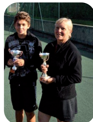
Les vainqueurs de consolantes