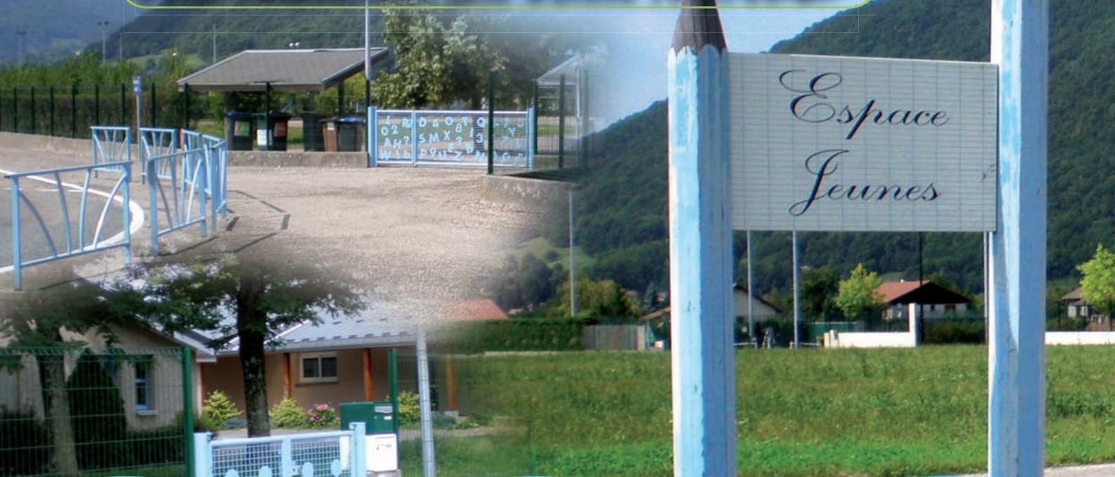
P 3 & 4 : Saison culturelle 2011-2012