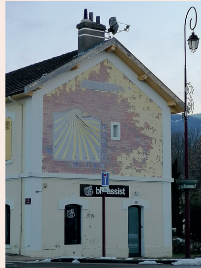
Novembre Réalisation du cadran solaire grâce au budget participatif