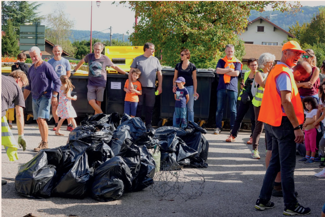
Le 25 septembre Nettoyage du village