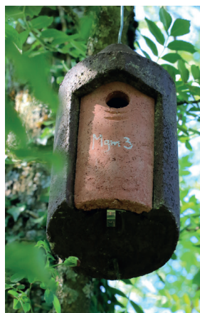
Nichoir en ciment de bois