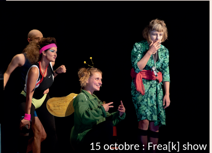
15 octobre : Frea[k] show