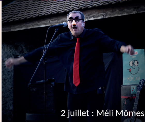
2 juillet : Méli Mômes

Une année riche en évènements, malgré la situation sanitaire