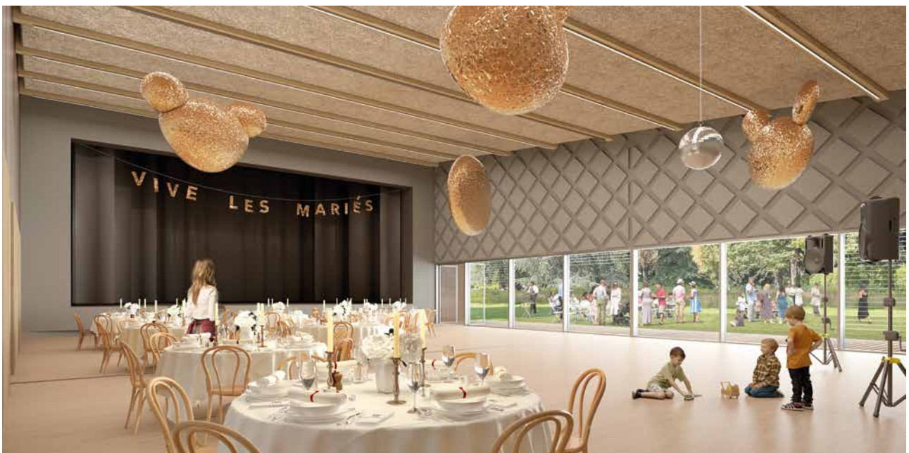
La grande salle • accueillante et ouverte sur le parc