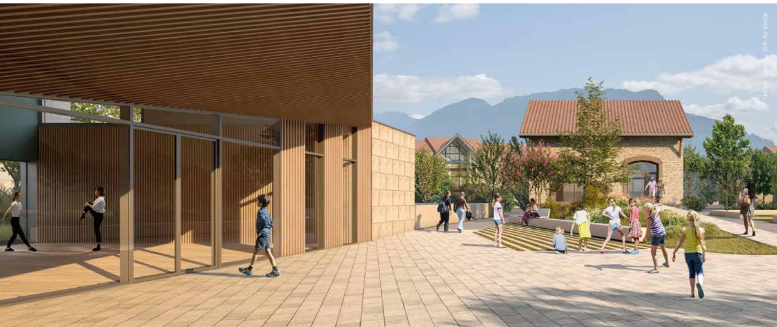
Vue du hall • être sous l'avent d'entrée, c'est être en relation avec la Mairie, l'ancienne Poste, et la grande Sure

Voici le projet retenu pour notre future salle multi-activités suite au concours d'architectes réalisé en 2023. Cette salle devra répondre à divers publics : associations, commune, écoles, habitants et acteurs locaux. Elle sera constituée de deux salles d'activités accessibles depuis le hall d'accueil : une grande salle d'une capacité de 300 personnes, dotée d'une scène et de locaux associés, et une seconde salle d'une capacité de 100 personnes, ainsi que des locaux fonctionnels (office, rangements matériels, loges, vestiaire...). L'actuelle salle de la poste sera conservée et valorisée et tous les abords seront aménagés et végétalisés. Un projet qui donnera à notre village un nouveau souffle en lien avec le centre bourg, la place du Puits Partagé et la mairie.