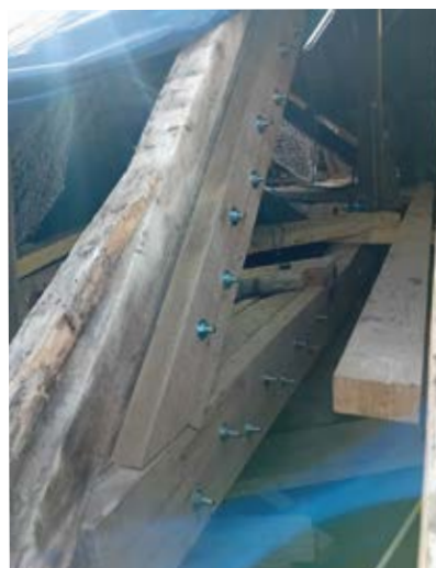
Schéma de principe de renforcement entre une pièce qui se nomme l'entrait et l'arbâlétrier ▼