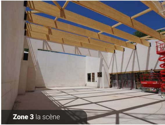
Zone 3 la scène