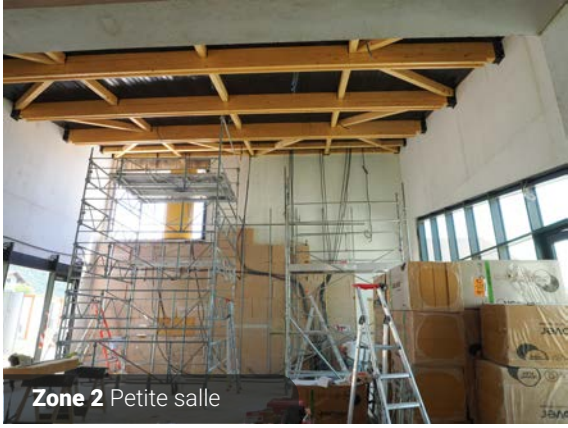
Zone 2 Petite salle