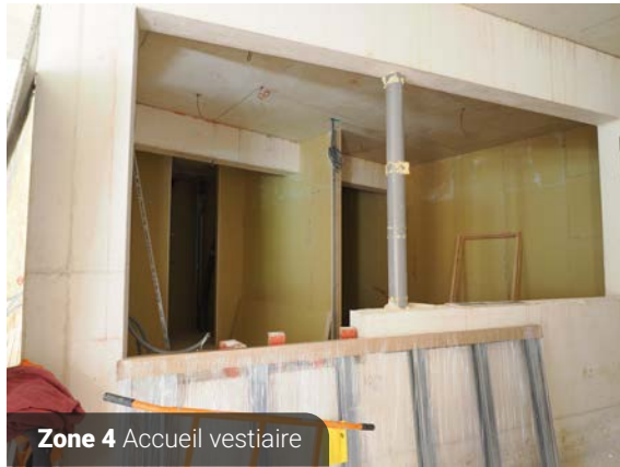
Zone 4 Accueil vestiaire