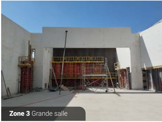
Zone 3 Grande salle