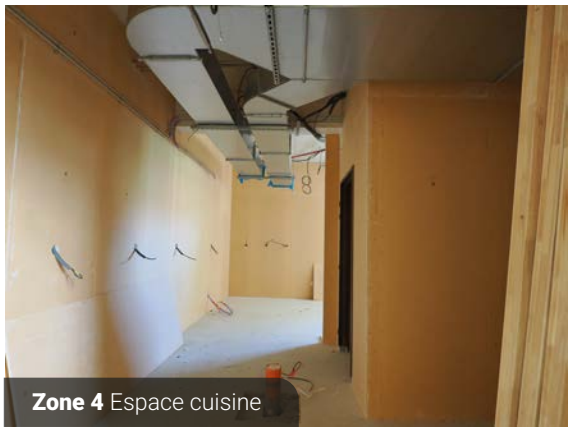
Zone 4 Espace cuisine