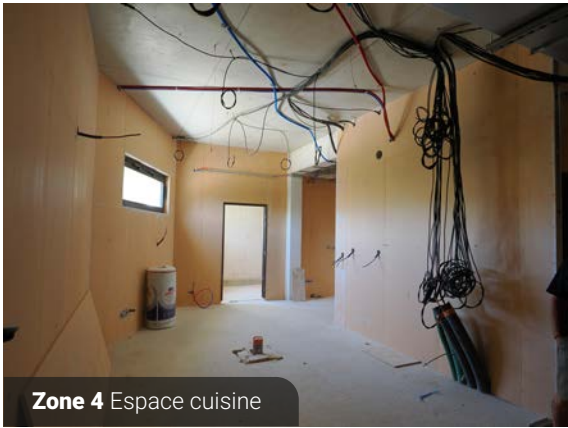
Zone 4 Espace cuisine